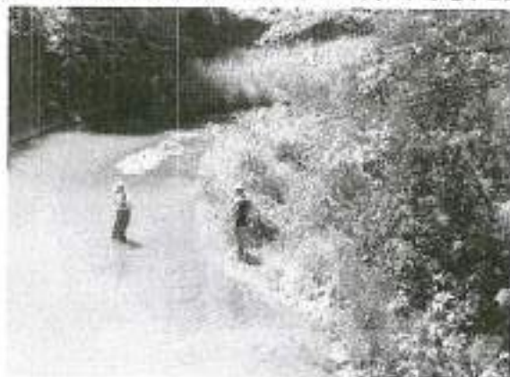
二宮町下浜橋上流で採水

● 2日後に全窒素と全リンを測定した。COD、pH、導電率と合わせ、採水場所の特徴が見られた。