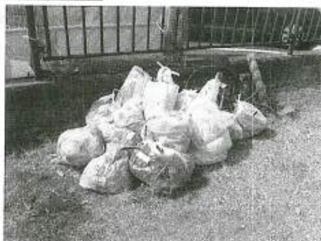
ゴミ集積場所(新田橋横)