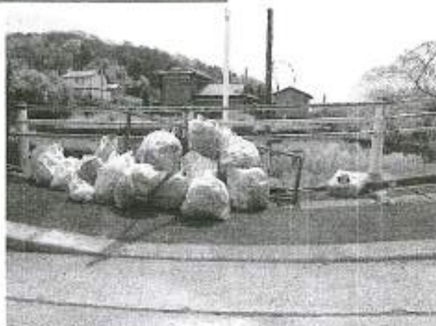
ゴミ集積所 前田橋

参加者 12名(成人男子9、成人女子1、大学生2) 作業時間 9:30~11:00 天気 曇り