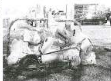
↑ ゴミ集積場所、清水橋