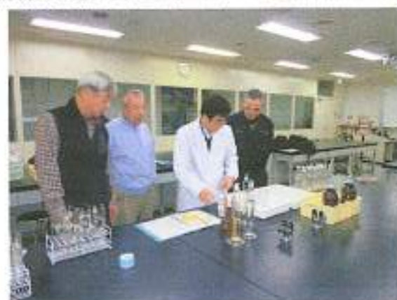
水質分析・神奈川県環境科学センター(平塚市)