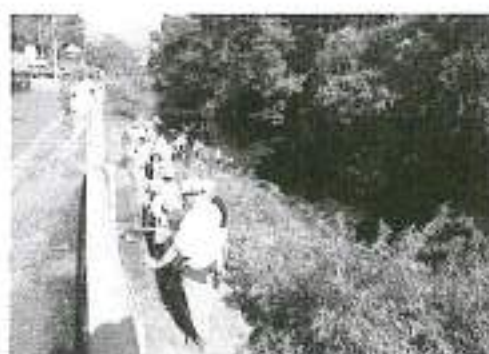
花月橋下流から葛川に入る学童