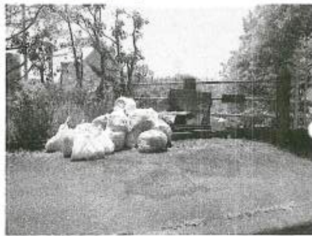
ゴミ集積所 西谷戸橋