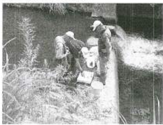
百合丘3丁目(マックスヴァリュ裏)