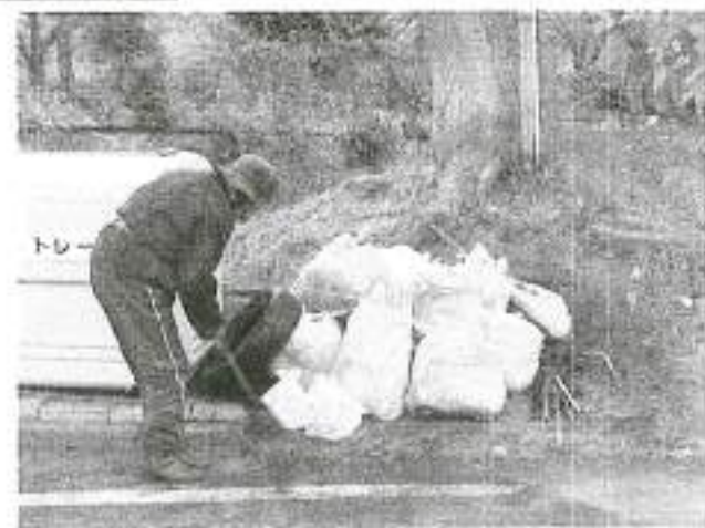
平成 24 年最後の清掃は後始末も完璧に・下浜橋