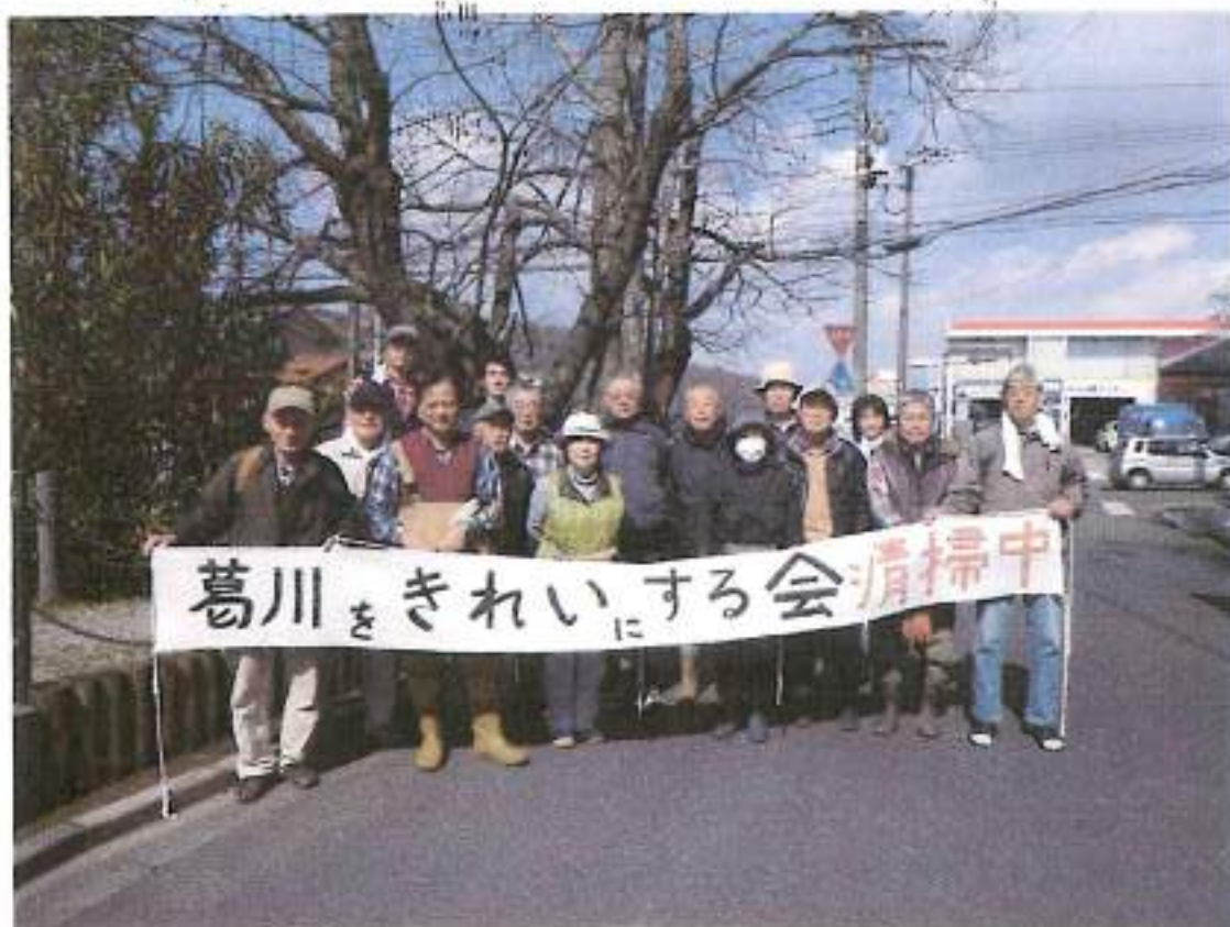
平成25年3月2日清水橋横にて