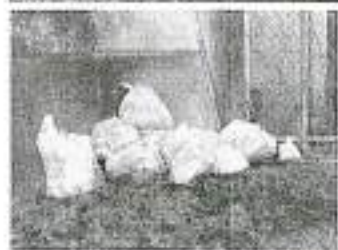
ゴミ集積所・小田厚道高架下