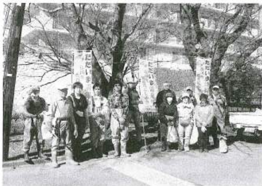
新しい帽を5本二宮町が 作ってくれました