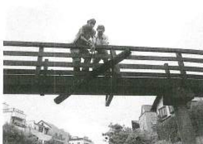
飯宿橋でゴミの引き上げ