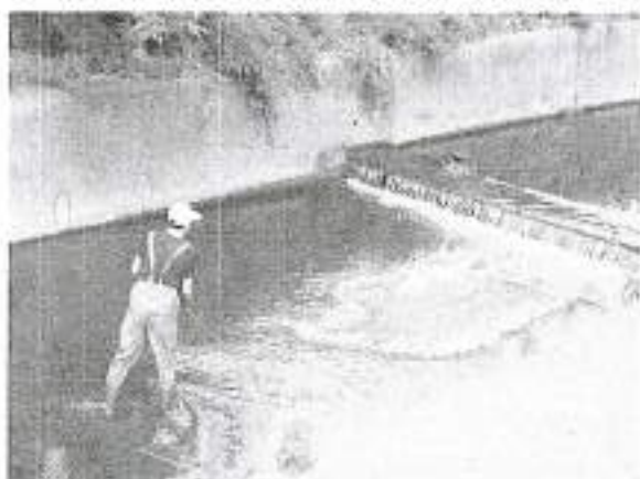
軒吉橋上流(西友裏)