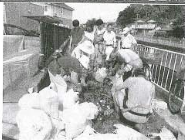
ゴミの分別(新田橋にて)