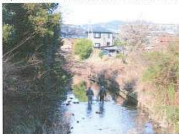
採水場所・二宮町、仮宿橋上流