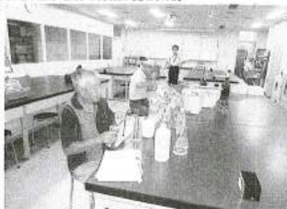
水質分析・神奈川県環境科学センターにて(平塚市)