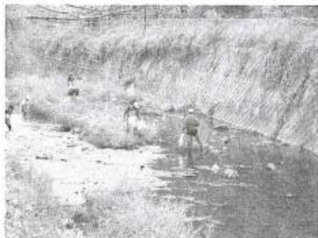
下浜橋～塩海橋中間