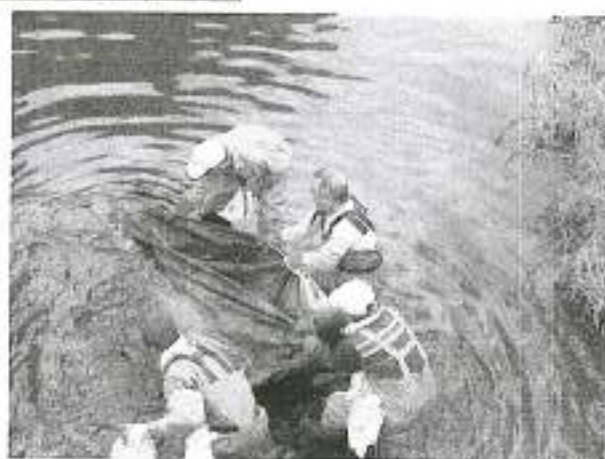
大きな麻袋(水を吸い重かった)