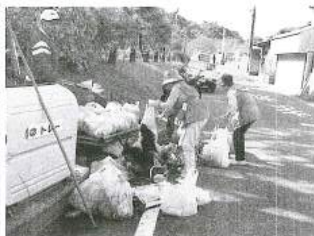
ゴミの選別(下浜橋横)