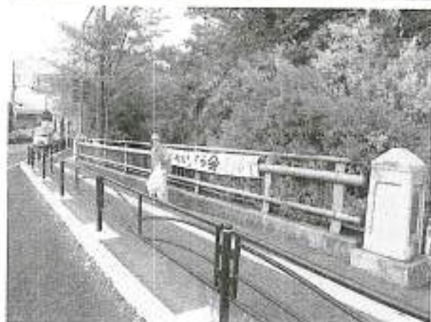
当日塩海橋に掲げた「葛川をきれいにする会」の募