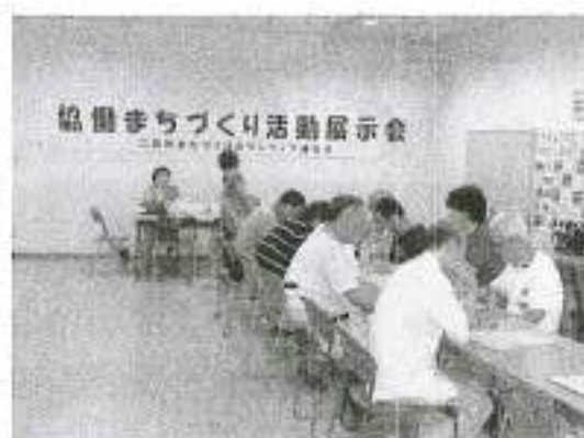
写真 上 会場風景