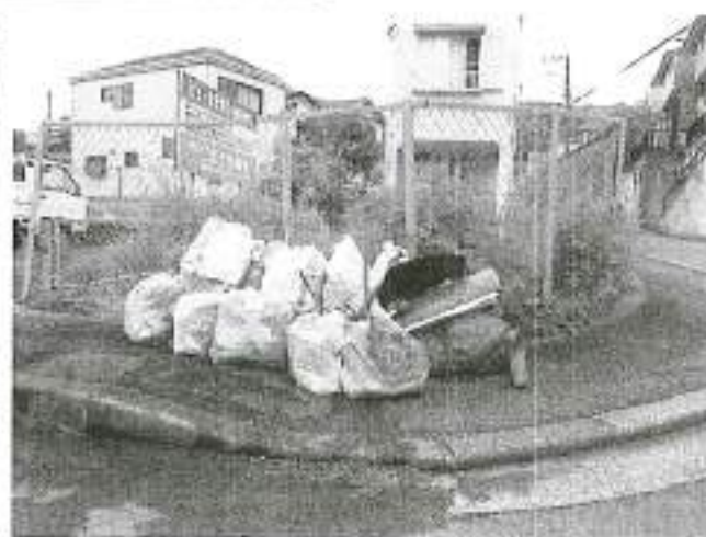
ゴミ集積所 花月橋横